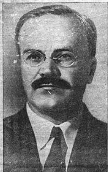
В. М. МОЛОТОВ, заместитель председателя Государствен- ного Комитета Обороны.