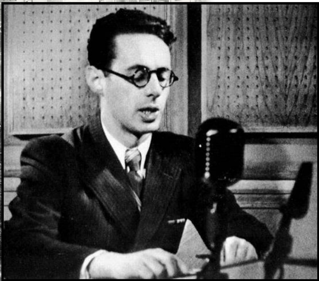
Юрий Борисович Левитан

диктор Всесоюзного радио Государственного комитета СМ СССР по телевидению и радиовещанию, народный артист СССР.