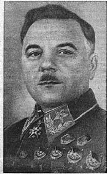
К. Е. ВОРОШИЛОВ.