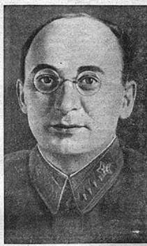
Л. П. БЕРИЯ.

По решению Президиума Верховного Совета СССР, Центрального Комитета ВКП(б) и Совета народных комиссаров СССР 30 июня 1941 года создан Государ- ственный Комитет Обороны в составе: