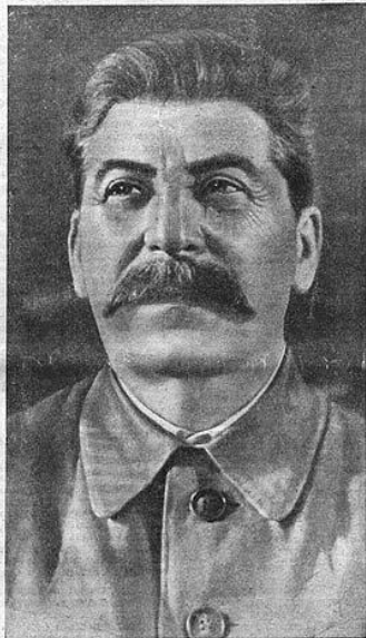
И. В. СТАЛИН, председатель Государственного Комитета Обороны.