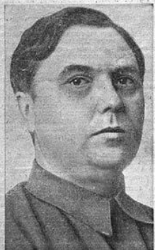
Г. М. МАЛЕНКОВ.